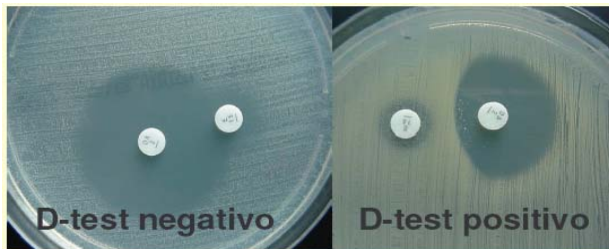
Figura 2. Izquierda: cepa de Staphylococcus epidermidis con resistencia a la eritromicina mediada por bomba de expulsión activa (D-test negativo). Derecha: cepa de S. aureus con fenotipo MLS_B inducible (D-test positivo).

La resistencia de los estafilococos a los aminoglucósidos es más frecuente en los ECN que en S. aureus . Según los datos del 6º estudio nacional de estafilococos realizado en 2006 y anteriormente mencionado, en S. aureus la tasa de resistencia a la gentamicina fue del 8,6% y a la tobramicina del 27%, mientras que en ECN estas cifras fueron del 44,2% y del 49,9%, respectivamente.