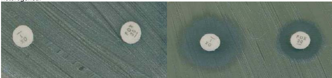
Figura 1. Detección de resistencia a la oxacilina en Staphylococcus mediante difusión con discos de oxacilina y cefoxitina. Imagen izquierda: cepa con resistencia homogénea. Imagen derecha: cepa con resistencia heterogénea.

Las cepas con resistencia intermedia a la oxacilina pero sensibles a la cefoxitina se deben informar como sensibles a la cefoxitina y nunca se debe informar una sensibilidad intermedia a la oxacilina.