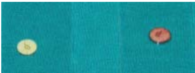
Figura 1. Prueba de detección de beta-lactamasa. Resultado: Izquierda: negativo; derecha: positivo

La betalactamasa es una enzima que modifica e inactiva las penicilinas. Si un microorganismo la produce, indica que éste es resistente a todas las penicilinas (penicilina, ampicilina, amoxicilina, carbenicilina, ticarcilina, azlocilina, mezlocilina y piperacilina). Para su detección se utilizan discos impregnados con una cefalosporina cromogénica (nitrocefina) que en presencia de una betalactamasa se hidroliza y debido al cambio en la configuración de electrones se obtiene un producto coloreado (figura 1).