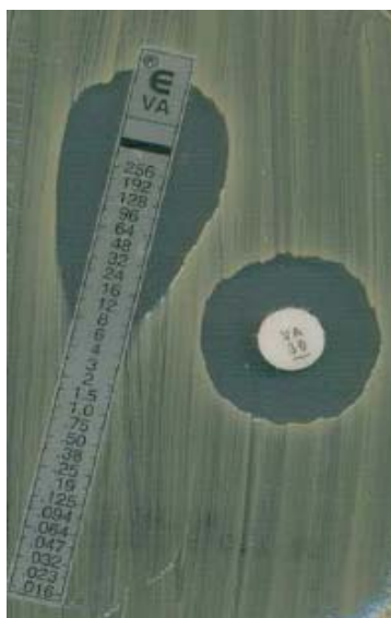
Figura 3. Staphylococcus aureus con resistencia intermedia a la vancomicina. CMI de vancomicina por Etest: 8 mg/L (la CMI por microdilución es 4 mg/L). Como se ha indicado anteriormente, el empleo del disco de vancomicina está desaconsejado (aparentemente la cepa podría parecer sensible).